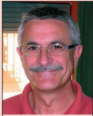
Eduardo Cuñat Ensenyament Privat