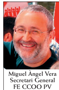
Miguel Àngel Vera Secretari General FE CCOO PV

EL PASSAT 28 DE MARÇ va ser l'últim dia per a fer inauguracions gràcies a la Llei electoral, abans de la convocatòria de les eleccions autonòmiques del dia 22 de maig. És doncs un bon moment per a començar a fer una anàlisi del fet pel Govern del PP i sobretot del realitzat per la Conselleria d'Educació i el conseller Font de Mora. De la propaganda usada com a instrument fonamental de l'acció política: 400 centres construïts o remodelats, 12 milions d'euros diaris invertits, l'anglès i el xinès implantat en els nostres centres, etc. això han venut. Caldrà explicar que els ciutadans paguem impostos i que aquests permeten l'acció de Govern, i que la construcció dels centres són resposta a una necessitat pactada que s'anomena en algun cas mapa escolar i en un altre és atendre les necessitats d'escolarització o el mal estat dels equipaments. Però això, sense ciutadans i ciutadanes, i sense els seus impostos no hi ha acció de Govern possible.